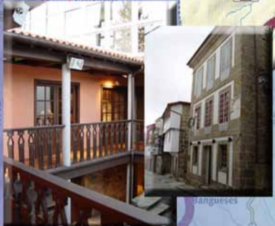
Casa de Curros