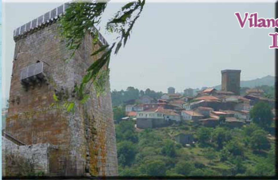
Vilanova dos Infantes