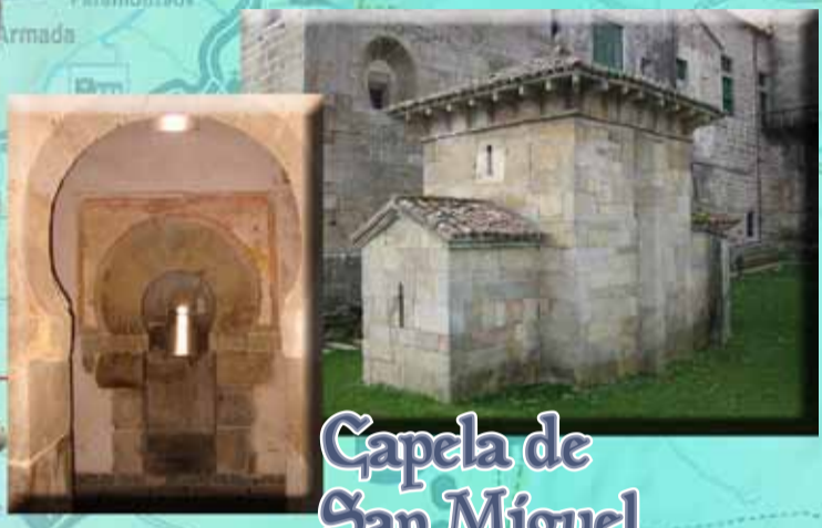
Capela de San Miguel